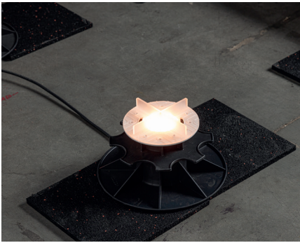
SCHRITT 1 Platzieren Sie zwei Schutzgummis unter dem Stelzlager.