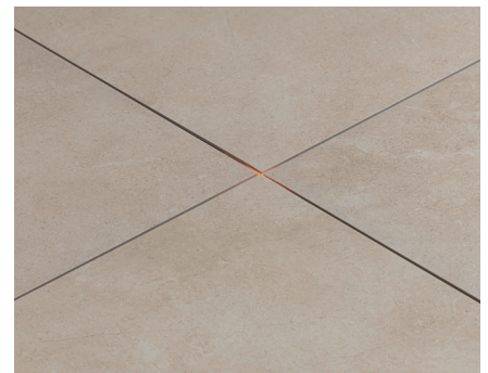
SCHRITT 6 Wählen Sie Ihre gewünschte Farbe und Stimmung über Ihr Smartphone.