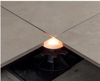
SCHRITT 4 Schließen Sie das Kabel an und stecken Sie es in die Steckdose.