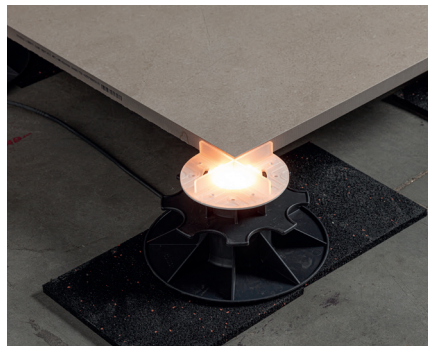
SCHRITT 2 Lassen Sie zwischen den Gummis eine Öffnung für das Kabel frei.