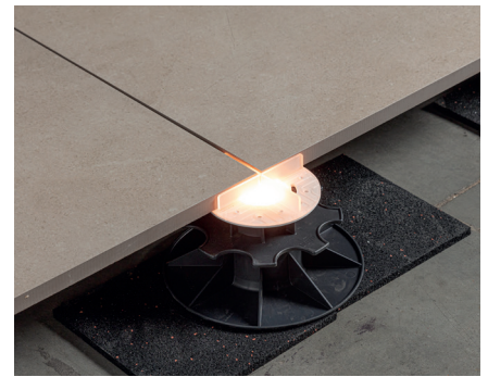
SCHRITT 3 Setzen Sie die Auflageplatte auf den Stelzlager.